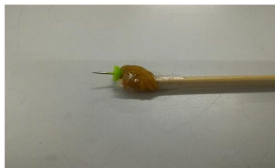
大頭針與竹筷結合