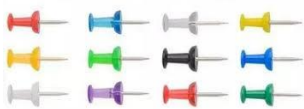
大頭針示意圖(或稱圖釘、塑頭釘)