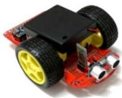
<小阿丟輪型機器人>